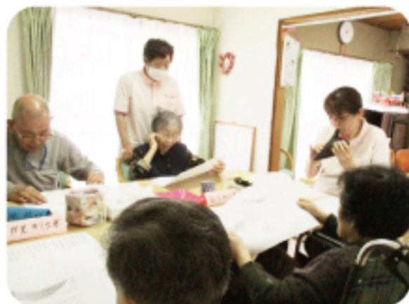
オカリナ演奏 音楽クラブ