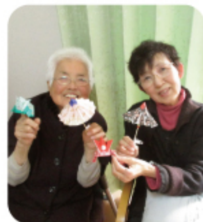
傘飾りとティッシュケース作り