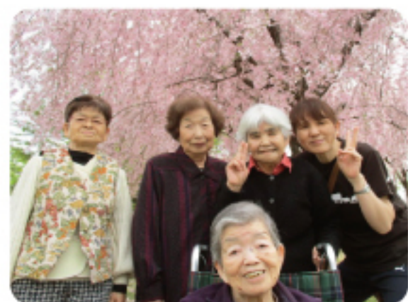
お花見とモーニング