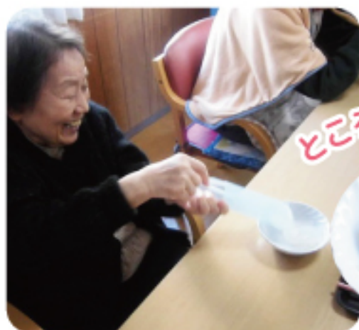
ところてんの完成!