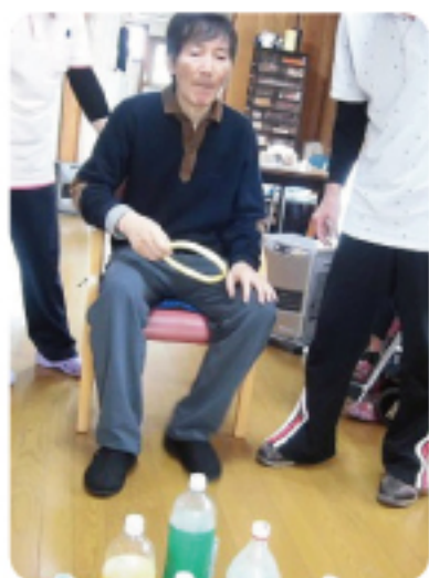
輪投げと早口言葉